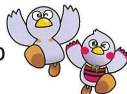
埼玉県マスコット 「コバトン」& 「さいたまっち」