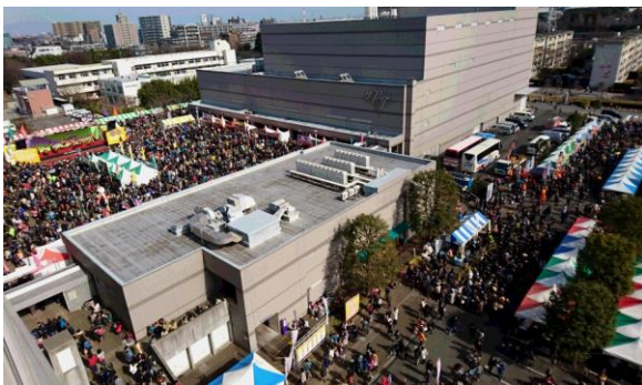
鍋ブース A・B 会場