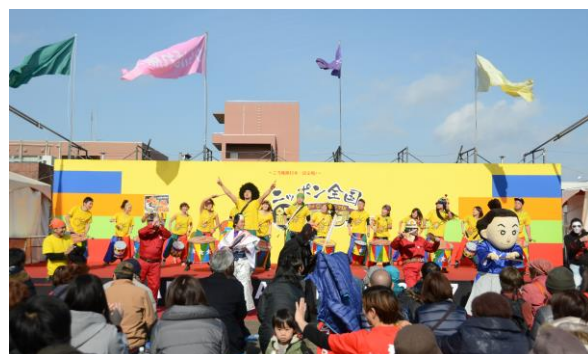
サブステージは若者たちで盛り上がり!