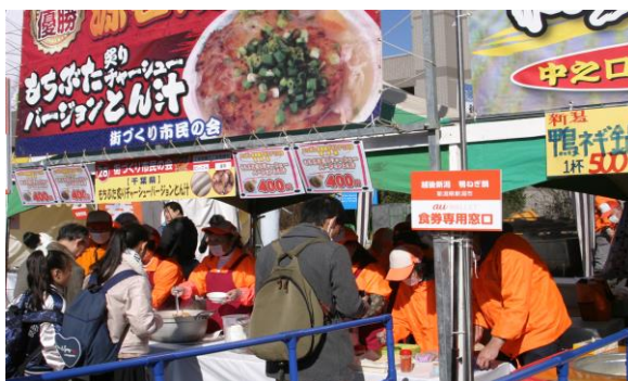
優勝鍋ブースは長蛇の列