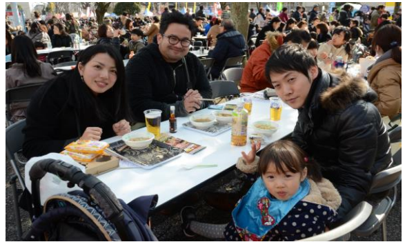
家族みんなで鍋に舌鼓