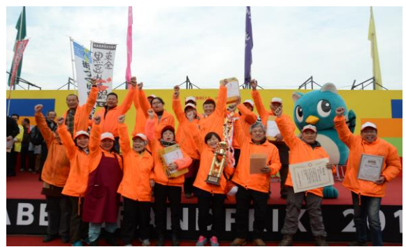
優勝チームの勝利の雄叫び!