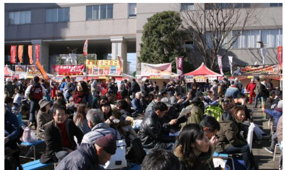
B 会場 飲食エリア