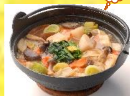
<上の写真はイメージ画像です>

農林水産省では、11月1日~8日を国産農林水産物消費拡大に向けた 取組強化週間「こくさんたくさん週間」として様々な事業を開催します。 本イベントも推進パートナーPRイベントとして連携開催します。