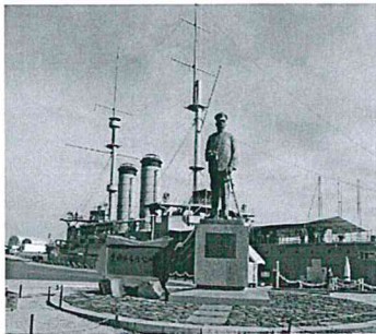
三笠公園「戦艦三笠」