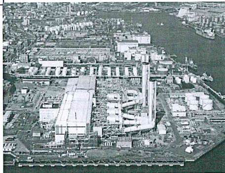
世界トップクラスの高効率発電所