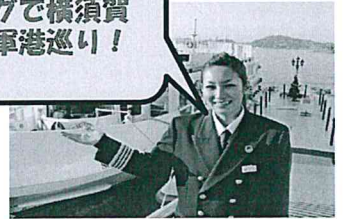
横須賀 「軍港めぐり」

(伊豆長岡温泉「ホテルサンバレー伊豆長岡」静岡県伊豆の国市 ※4～5名で1室となります)